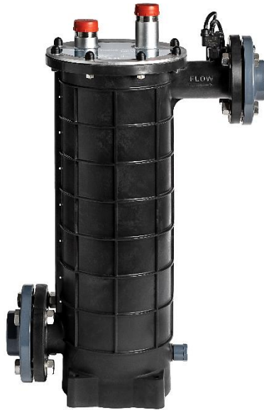
X-KWT AISI 161